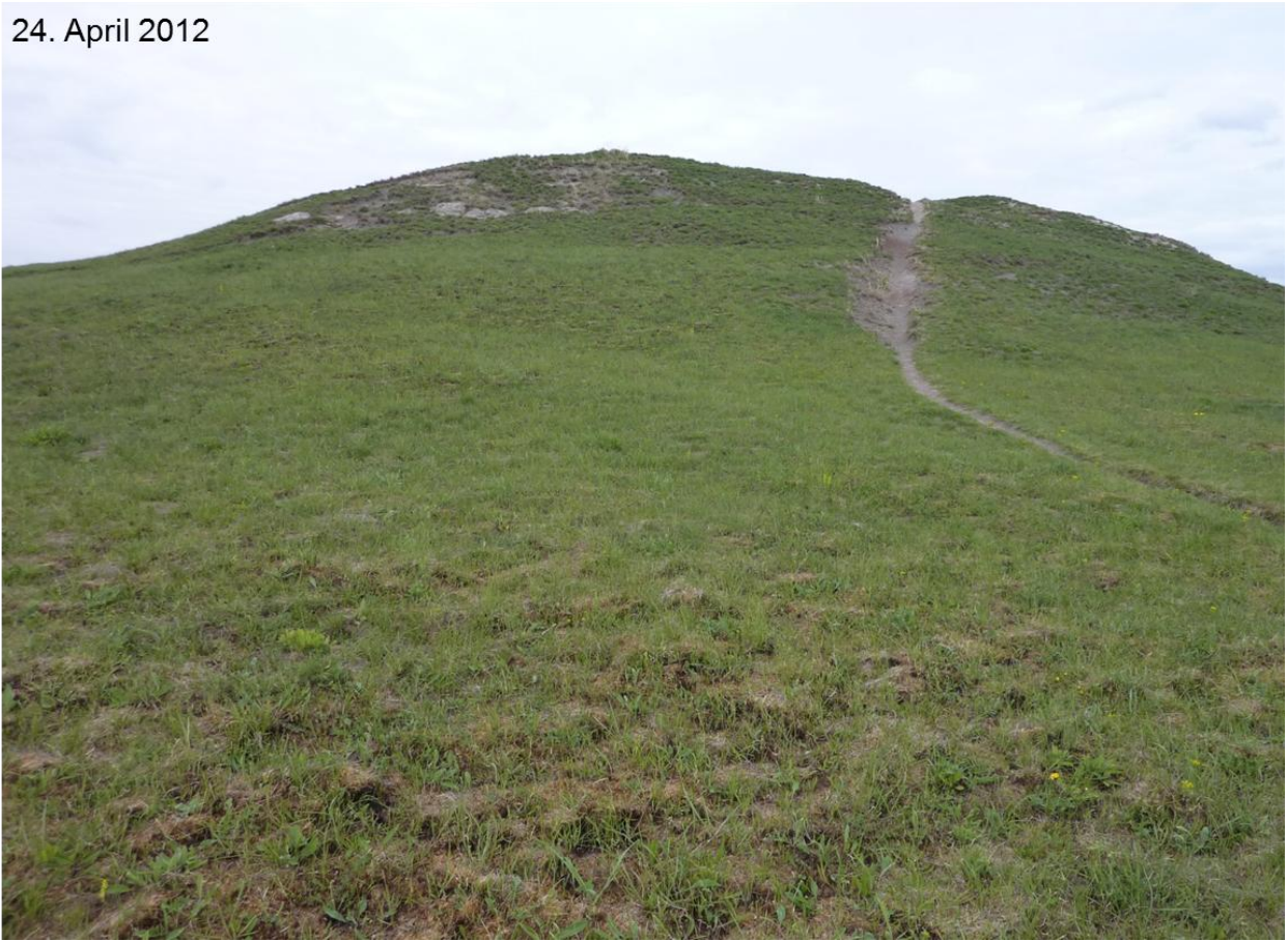
Abb. 9 Zustand etwa 2 Monate nach dem Feuereinsatz (Kippelhorn)