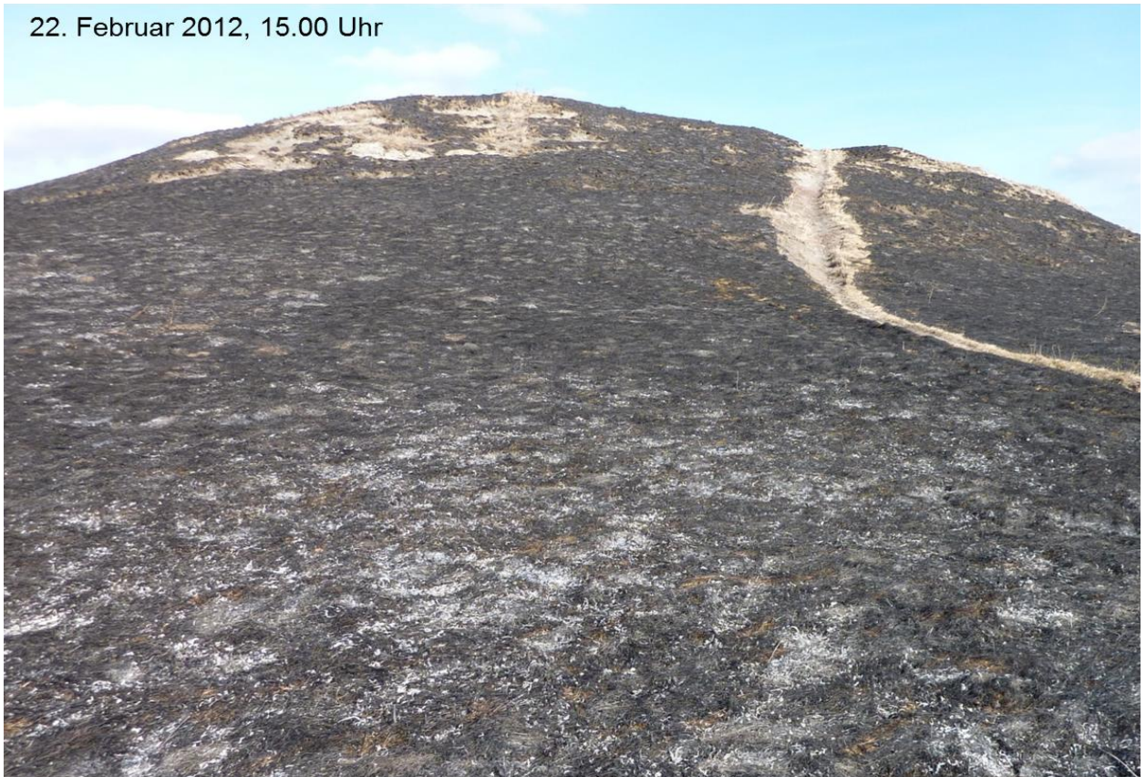
Abb. 8 Zustand direkt nach dem Feueinsatz (Kippelhorn)