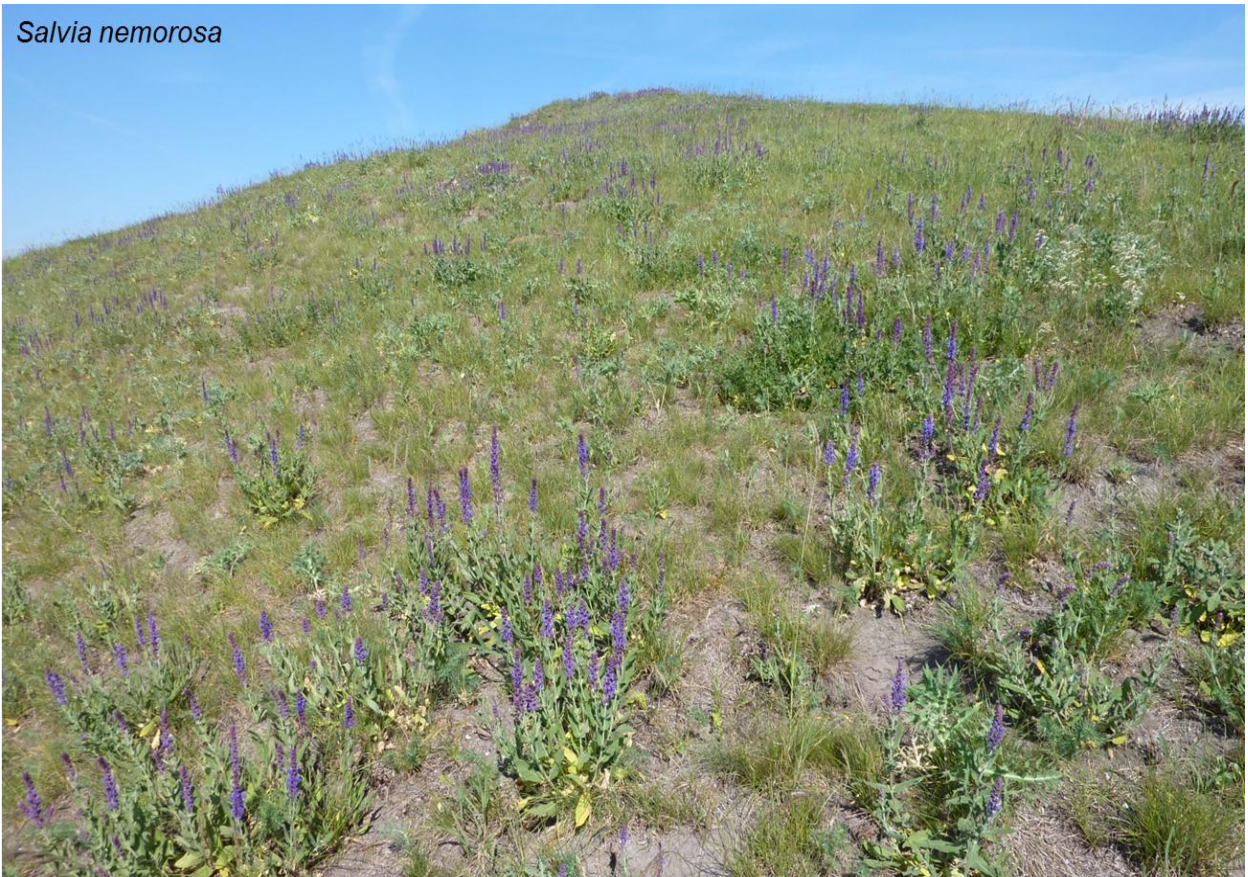
Abb. 11 Blühaspekt im Juli nach dem Feuereinsatz (Kippelhorn)