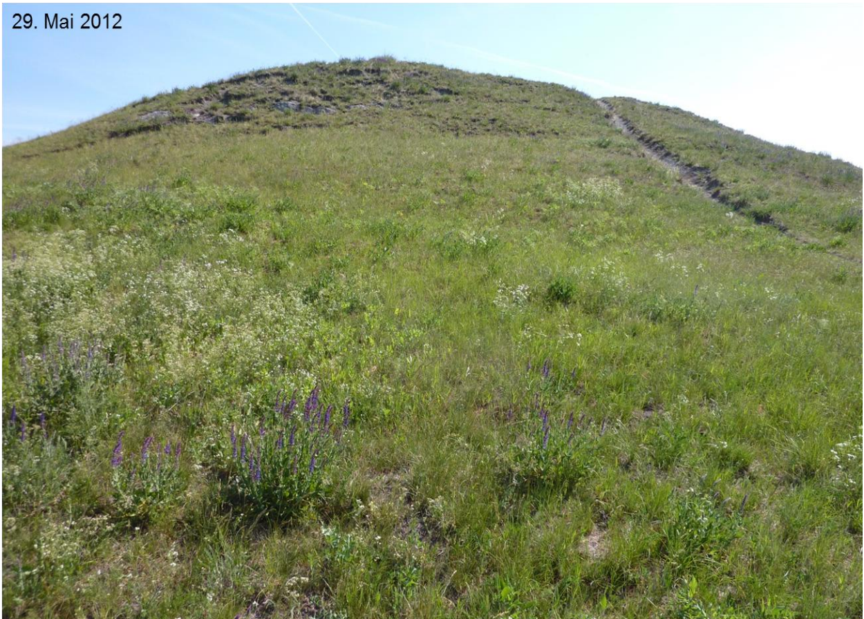
Abb. 10 Zustand etwa 3 Monate nach dem Feuereinsatz (Kippelhorn)