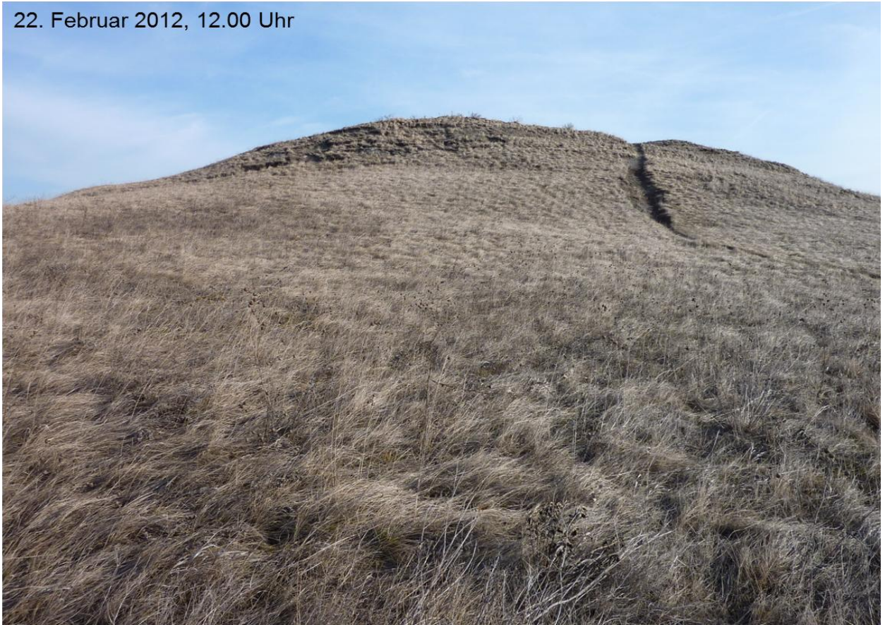
Abb. 7 Zustand vor dem Feueinsatz (Kippelhorn)