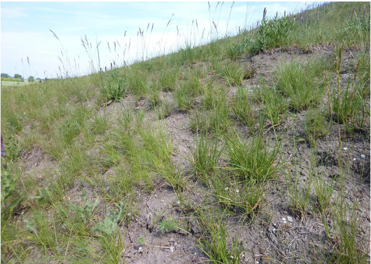
Abb. 12 Lückige Rasen mit Pfiemengras ( Stipa capillata ) und Aufrechter Trespe ( Bromus erectus ) im Juli nach dem Feuereinsatz (Kippelhorn)